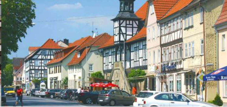
Ostheim v. d. Rhön Marktstraße